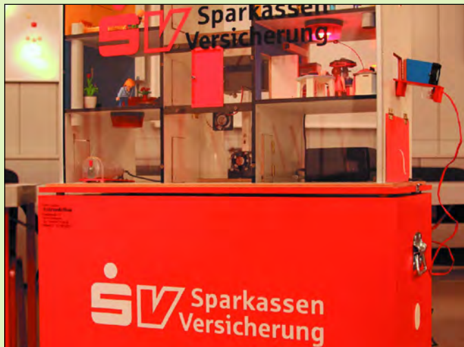
Rechts am „Gebäude“ der Kleinlüfter zur Entrauchung

Das vierstöckige Rauchhaus ist gefüllt mit moderner Technik und vollständig eingerichtet wie ein Wohnhaus, die Räume und