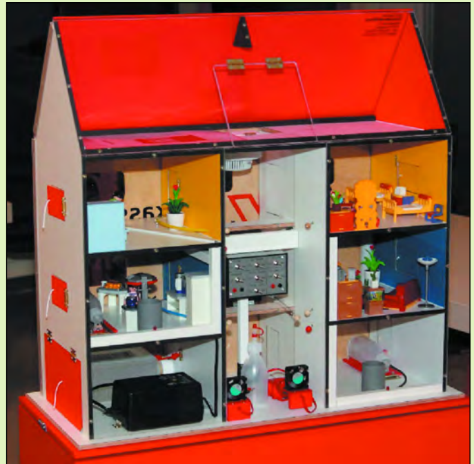
Das Rauchhaus mit seiner elektronischen Steuerung